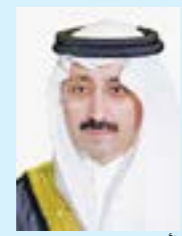
الأمير بدر بن محمد بن جلوي

حضور نسوي متميز بأوراق أعمال متخصصة في الإعلام