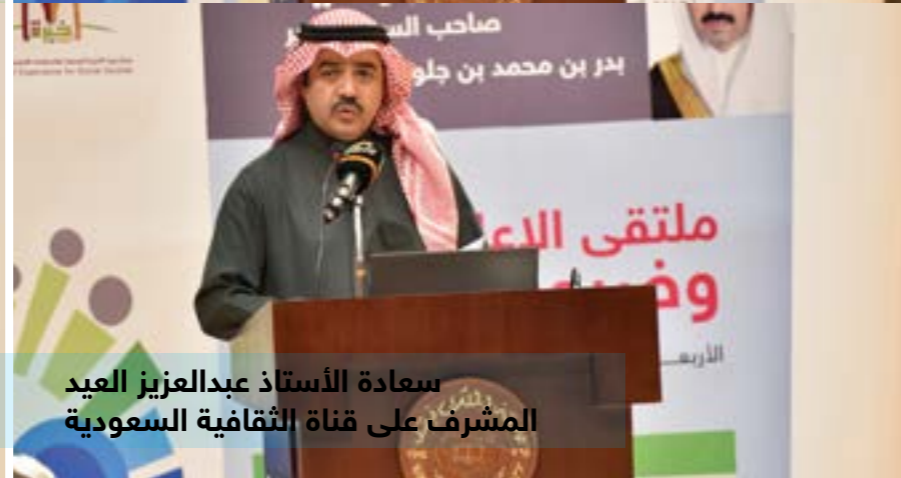
سعادة الأستاذ عبدالعزيز العيد المشرف على قناة الثقافية السعودية