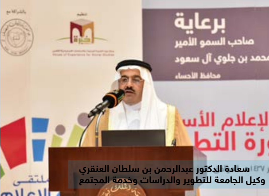
سعادة الدكتور عبدالرحمن بن سلطان العنقري وكيل الجامعة للتطوير والدراسات وخدمة المجتمع