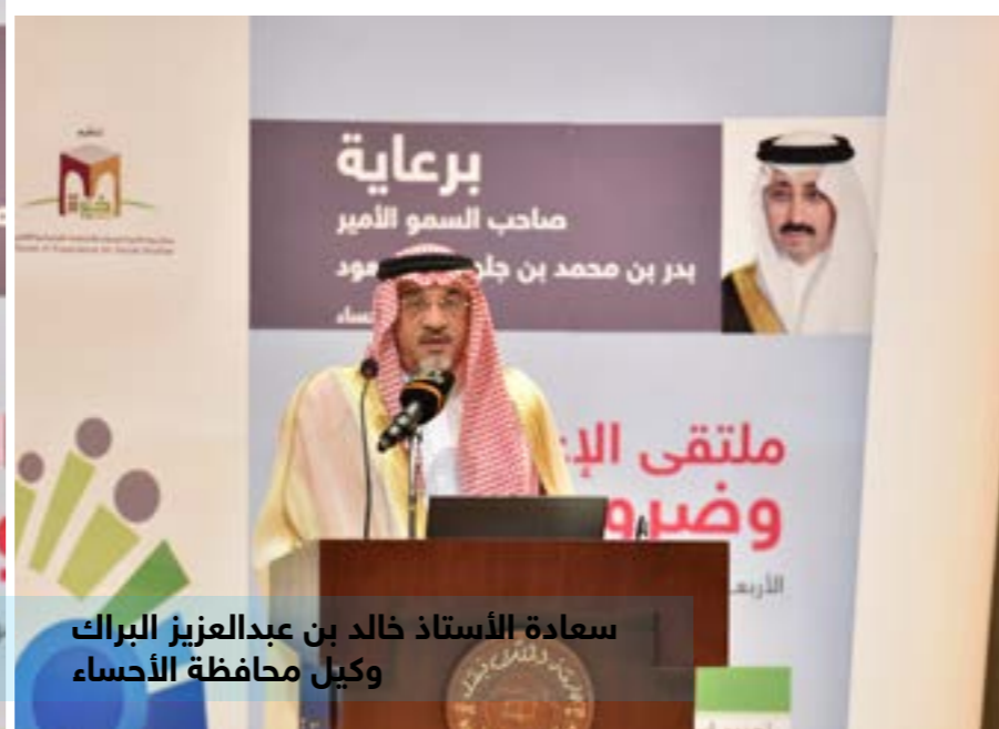
سعادة الأستاذ خالد بن عبدالعزيز البراك وكيل محافظة الأحساء